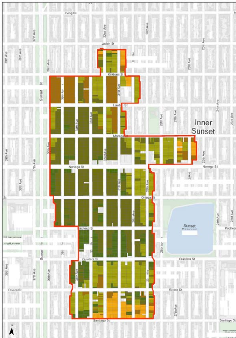
Sunset Residential Tract Survey Area